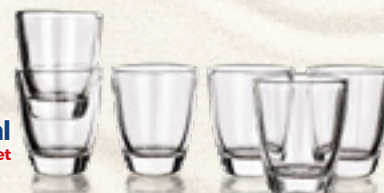
KIELISZKI 30 ml Banquet