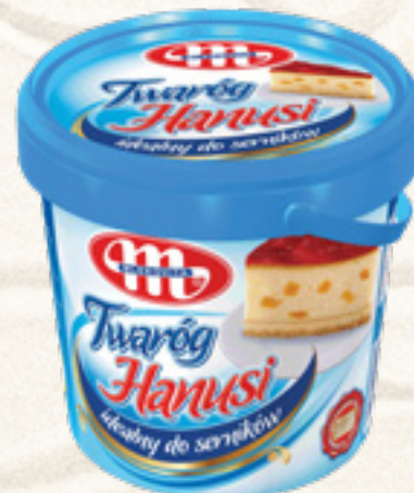
TWARÓG SERNIKOWY HANUSI 1 kg MLEKOVITA

KATALOG PRODUKTÓW BIORĄCYCH UDZIAŁ W LOTERII