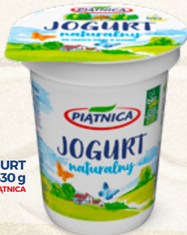
JOGURT NATURALNY 330 g PIATNICA