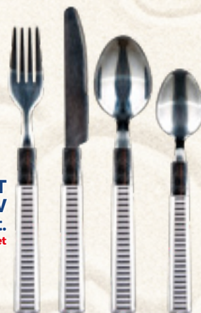
KOMPLET SZTUĆCÓW LINSE 24 szt. Banquet