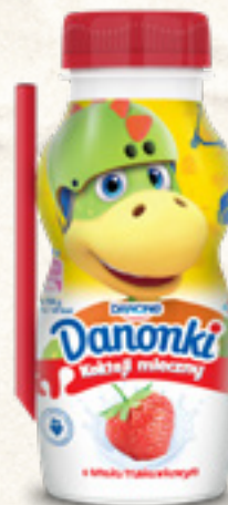
DANONKI TRUSKAWKA 185 g WYBRANY ASORTYMENT DANONE