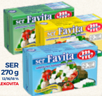
SER FAVITA 270 g 12/16/18% MLEKOVITA