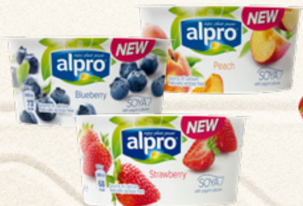
JOGURT SOJOWY ALPRO 150 g JAGODA, BRZOSKWINIA, TRUSKAWKA DANONE