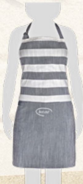
FARTUCH KUCHENNY Z KIESZONIĄ, BEST CHEF 75x80 cm, SZARY Banquet