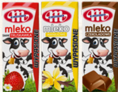
MLEKO SMAKOWE 200 ml CZEKOLADOWE, TRUSKAWKOWE, WANILIOWE MLEKOVITA