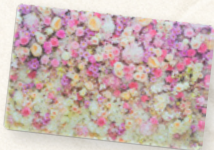
MATA PLASTIKOWA FLOWER