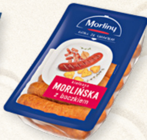
KIEŁBASA MORLIŃSKA Z BOCZKIEM MORLINY ANIMEX FOODS