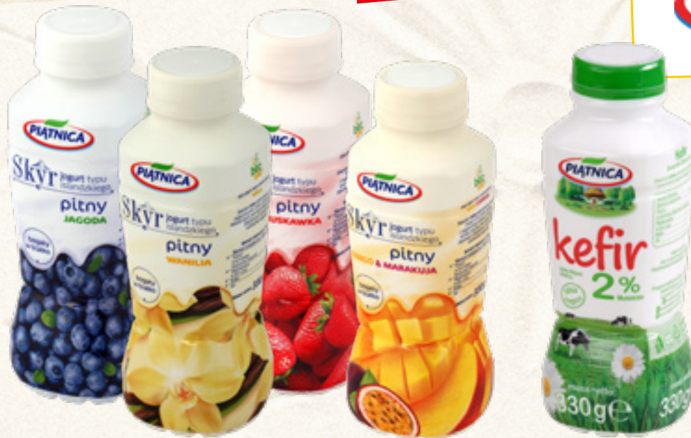
JOGURT PITNY SKYR 330 ml JAGODA, MANGO MARAKUJA, TRUSKAWKA, WANILIA PIATNICA