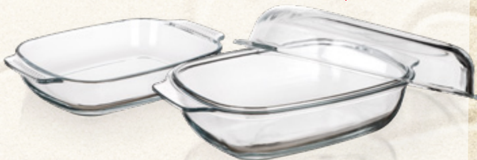
SZKLANA BRYTFANKA CASEO 2/5,7 L