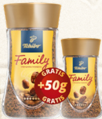
KAWA FAMILY 200g+50g INSTANT TCHIBO