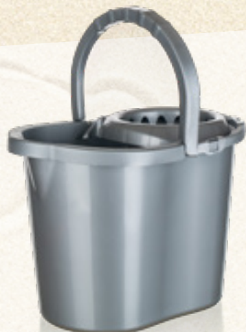
WIADRO 13 L Z WYŻYMACZEM Banquet