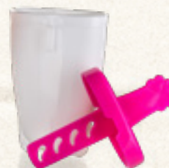
FOREMKA DO PRODUKCJI LODÓW ACASSA 4 szt.