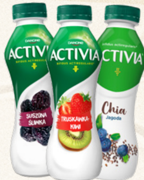
JOGURT ACTIVIA 280/290/300 g WYBRANY ASORTYMENT DANONE