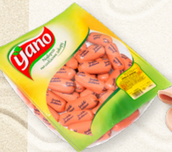
SERDELKI DROBIOWE YANO ANIMEX FOODS