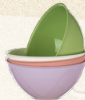
MISKA PLASTIKOWA OKRĄGŁA CANDY 2,5/4,5 L