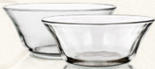
MISKA SZKLANA SUPER VALUE