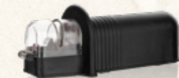
OSTRZAŁKA - OSEŁKA SAVOY Banquet