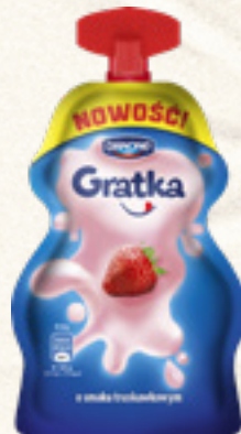
GRATKA W SASZETCE 65 g TRUSKAWKA DANONE