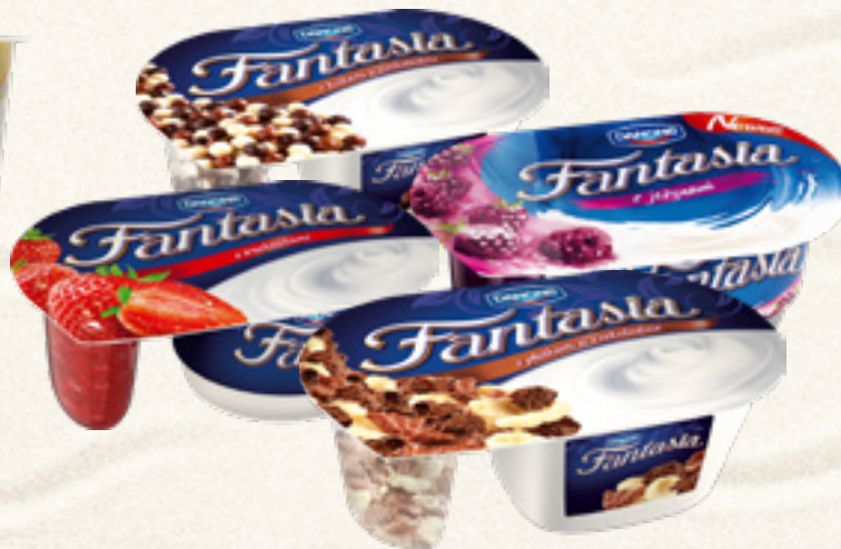
JOGURT FANTASIA 100-122 g WYBRANY ASORTYMENT DANONE