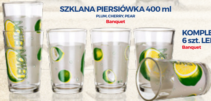
KOMPLET SZKLANEK 6 szt. LEMON 230 ml Banquet