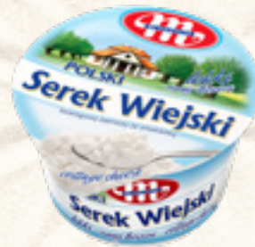
SEREK WIEJSKI POLSKI LEKKI 3% 150 g MLEKOVITA