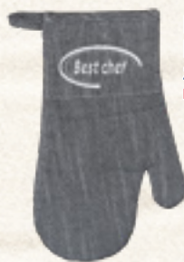
RĘKAWICA BEST CHEF 18x30 cm, SZARA Banquet