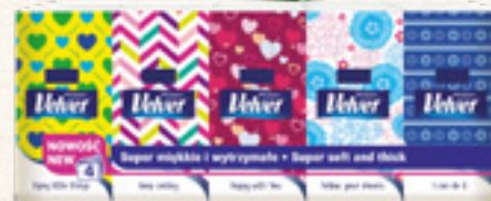
CHUSTECZKI HIGIENICZNE VELVET UNIERSALNE WYBRANY ASORTYMENT VELVET CARE