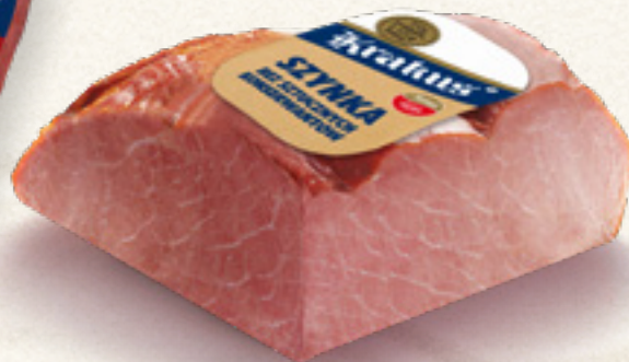
SZYNKA BEZ SZTUCZNYCH KONSERWANTÓW KRAKUS ANIMEX FOODS