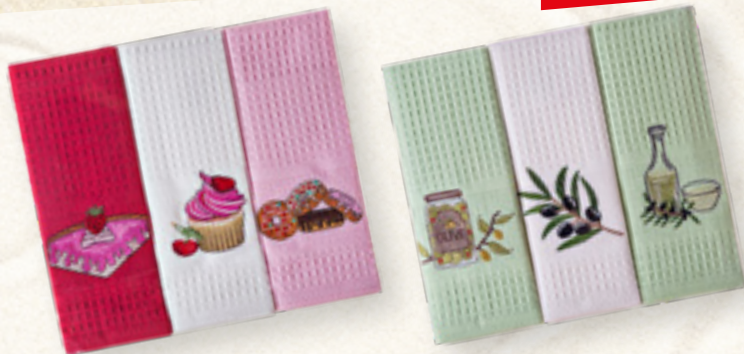
KOMPLET ŚCIEREK 45x70 cm OLIVES