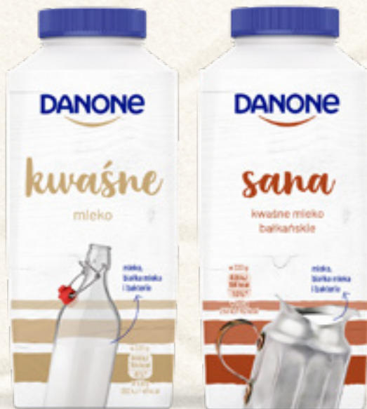
MLEKO 320 g KWAŚNE/SANA KWAŚNE MLEKO BAŁKAŃSKIE DANONE