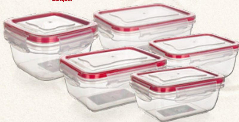
POJEMNIK PLAST CUL

0,275/0,4/0,8/1,4/2,3 L CZERWONY Banquet