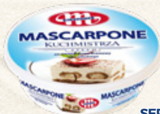
SEREK MASCARPONE 250 g KUCHMISTRZA MLEKOVITA