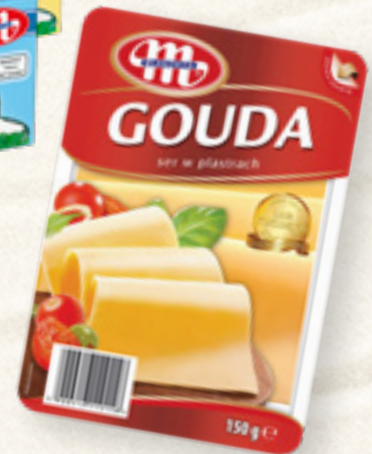
SER GOUDA PŁASTRY 150 g MLEKOVITA