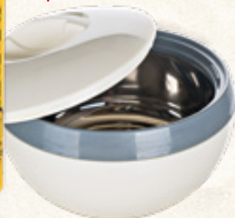
TERMOS OBIADOWY ALLEGRIA 1,5/0,6 L Banquet