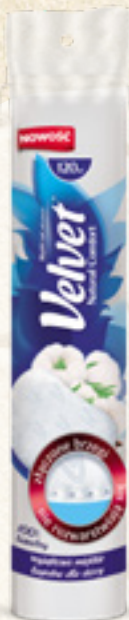
PŁATKI KOSMETYCZNE VELVET 120 szt. VELVET CARE