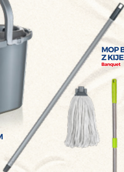
MOP BAWELNIANY 160 g Z KIJEM 120 cm Banquet