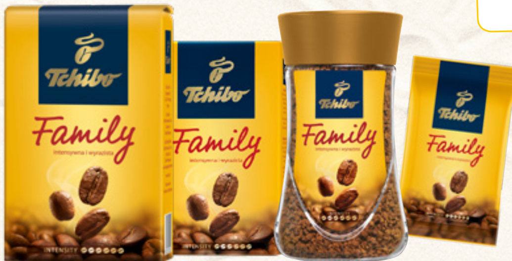
KAWA FAMILY 100/200/250/500 g MIELONA/ROZPUSZCZALNA TCHIBO