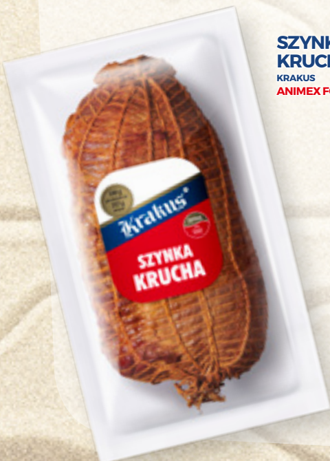
SZYNKA KRUCHA KRAKUS ANIMEX FOODS