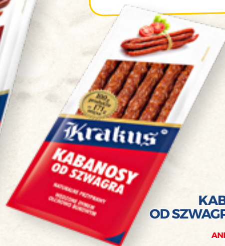
KABANOSY OD SZWAGRA 150 g KRAKUS ANIMEX FOODS