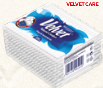
PATYCZKI KOSMETYCZNE VELVET 200 szt. VELVET CARE