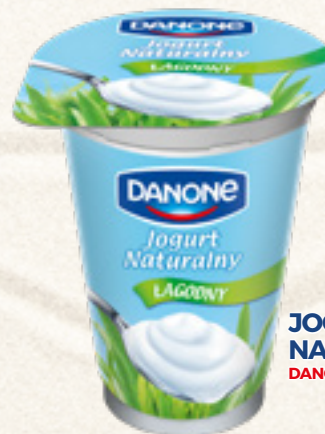
JOGURT NATURALNY 165 g DANONE

KATALOG PRODUKTÓW BIORĄCYCH UDZIAŁ W LOTERII