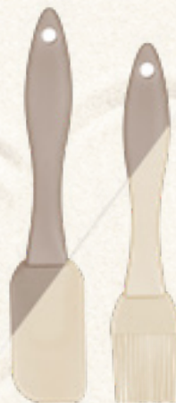
SZPATUŁKA I PĘDZELEK CULINARIA Banquet