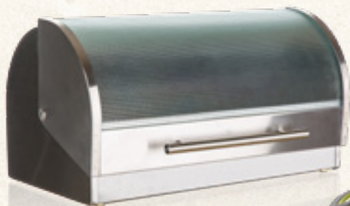
CHLEBAK CANDDY Banquet