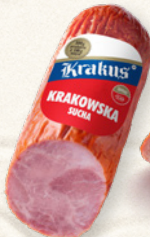
KIEŁBASA KRAKOWSKA SUCHA 320 g KRAKUS ANIMEX FOODS