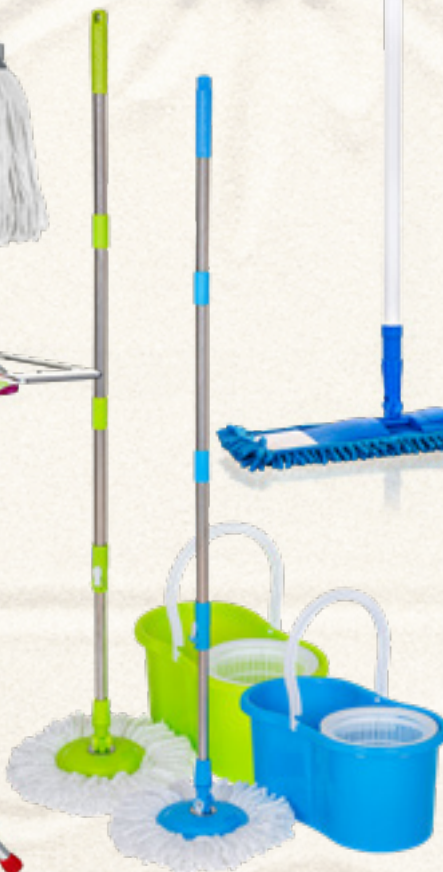
MOP ROTERO + 2 ZAMIENNE WKŁADY Banquet