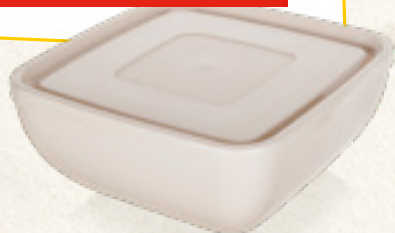
MISKA UNIVERSALNA QUATRO