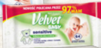
CHUSTECZKI NAWILŻANE VELVET WYBRANY ASORTYMENT VELVET CARE