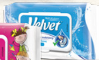
PAPIER TOALETOWY NAWILŻANY VELVET WYBRANY ASORTYMENT VELVET CARE