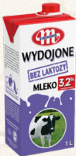
MLEKO WYDOJONE BEZ LAKTOZY UHT 1L 3,2% MLEKOVITA