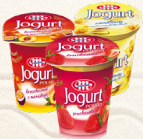
JOGURT POLSKI 350 g TRUSKAWKOWY, BRZOSKWINIA Z MARAKUJA, WANILIOWY MLEKOVITA