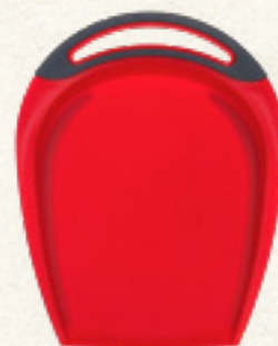
DESKA DO KROJENIA 30x20 cm; 36,3x27,5 cm; 32x25 cm Banquet