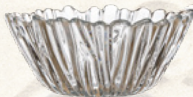
MISKA SZKLANA AURORA