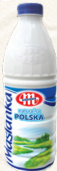
MAŚLANKA NATURALNA POLSKA 1000 g MLEKOVITA