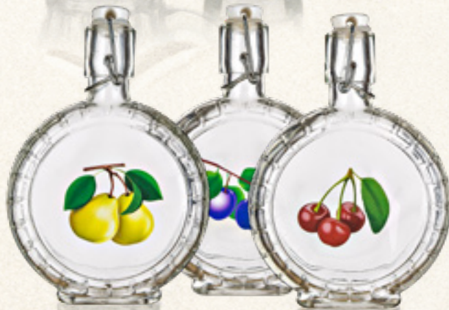
SZKLANA PIERSIÓWKA 400 ml PLUM, CHERRY, PEAR Banquet