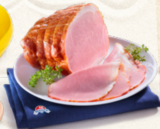
SZYŃKA STAROPOLSKA MAZURY ANIMEX FOODS

KATALOG PRODUKTÓW BIORĄCYCH UDZIAŁ W LOTERII