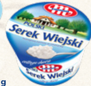
SEREK WIEJSKI POLSKI 200 g MLEKOVITA