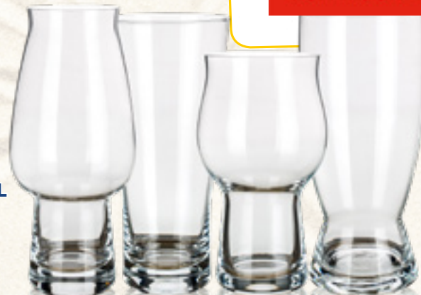
KOMPLET SZKLANEK DO PIWA 4 szt. Banquet