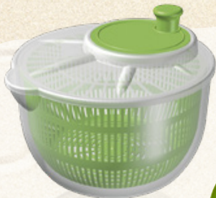
WIROWKA DO SAŁATY 2,5 L