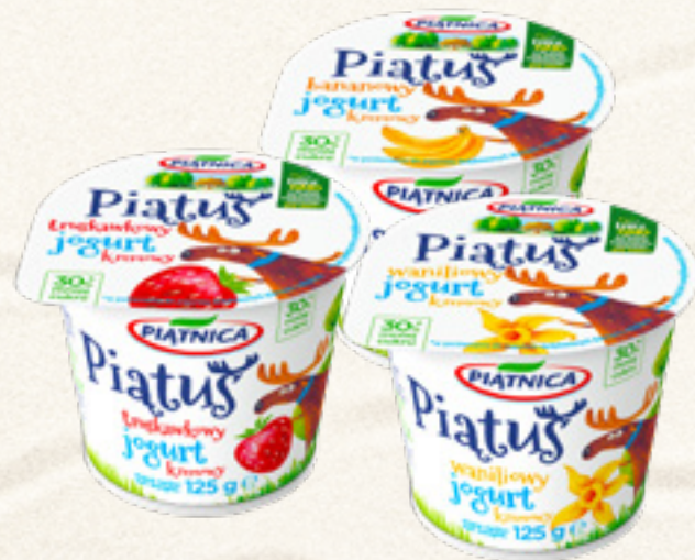
JOGURT PIATUS 125 g BANAN, TRUSKAWKA, WANILIA, PIATNICA