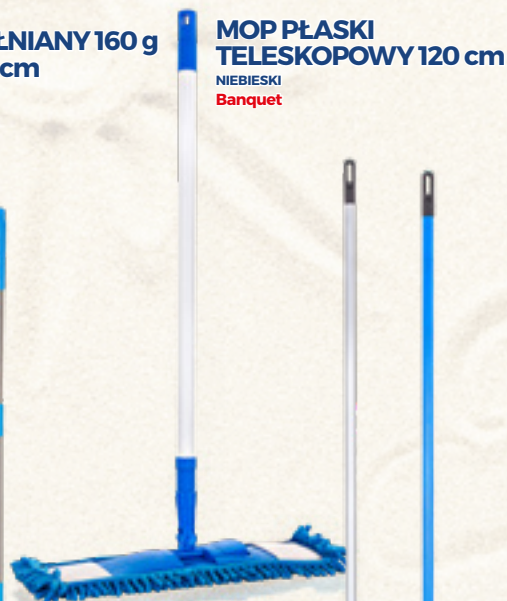
MOP PŁASKI TELESKOPOWY 120 cm NIEBIESKI Banquet