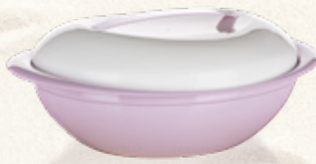
MISKA Z POKRYWKĄ CANDY 2,75 L