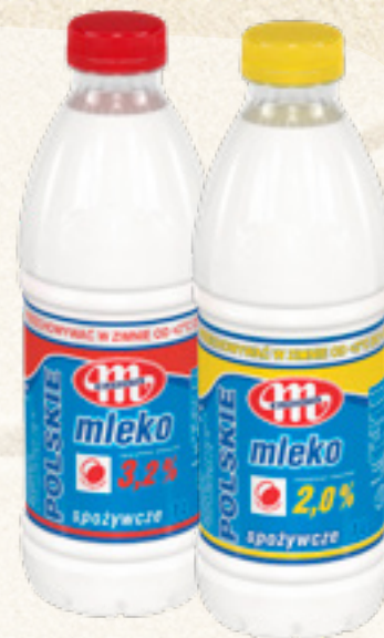
MLEKO POLSKIE 2/3,2% 1L MLEKOVITA