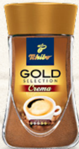
KAWA GOLD 180 g SELECTION CREMA TCHIBO