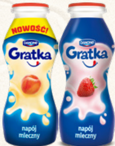
NAPÓJ MLECZNY GRATKA 170 g TRUSKAWKOWY, BRZOSKWINIOWY DANONE