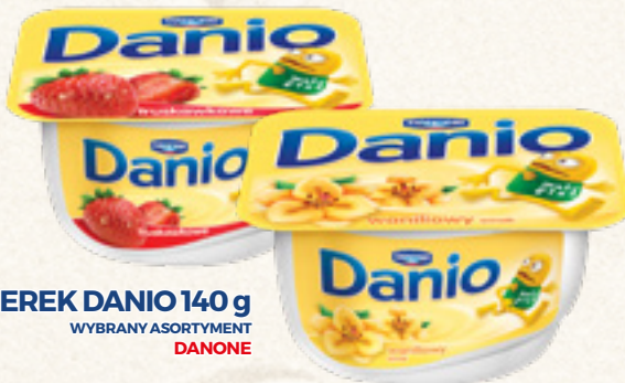
SEREK DANIO 140 g WYBRANY ASORTYMENT DANONE