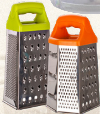
TARKA NIERDZEWNA 4-STRONNA CULINARIA