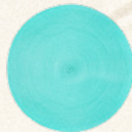
PODKŁADKA PLASTIKOWA OKRĄGŁA NIEBIESKA