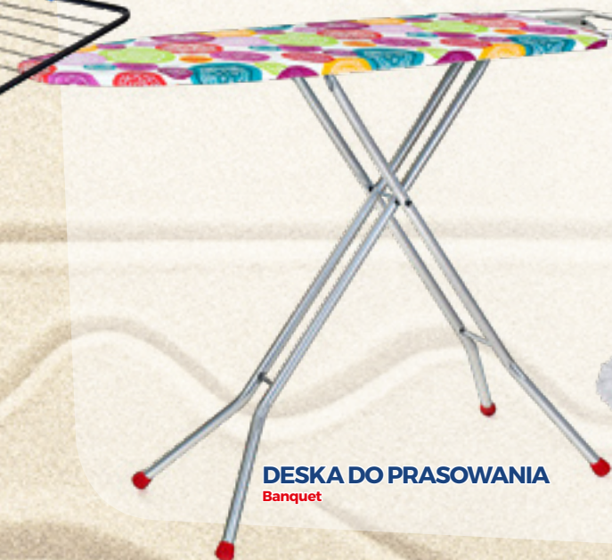
DESKA DO PRASOWANIA Banquet