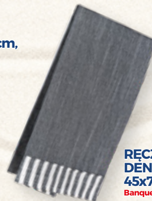
RĘCZNIK KUCHENNY DÉNIM STRIPES 45x70 cm, SZARY Banquet