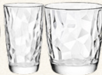
SZKLANKA DIAMOND 300/470 ml PRZEZROCZYSTA Banquet