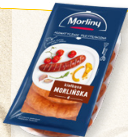
KIEŁBASA MORLIŃSKA MORLINY ANIMEX FOODS