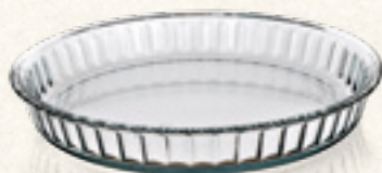
FORMA TARTA SIMAX