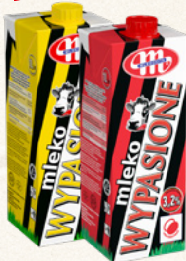
MLEKO WYPASIONE UHT 2/3,2% 1L MLEKOVITA