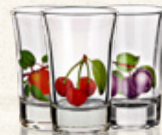
KIELISZKI VERONA 6 szt. APRICOT, CHERRY, PLUM Banquet