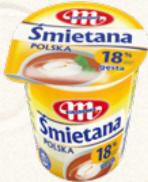
ŚMIETANA POLSKA 18% 400 g MLEKOVITA