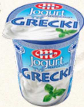
JOGURT NATURALNY TYP GRECKI 400 g MLEKOVITA