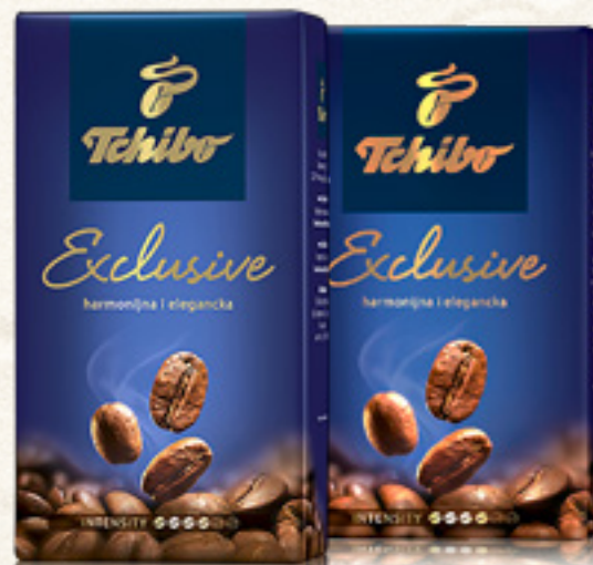
KAWA TCHIBO EXCLUSIVE 500 g ZIARNISTA/MIELONA TCHIBO