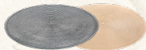
PODKŁADKA OKRĄGŁA TONDO