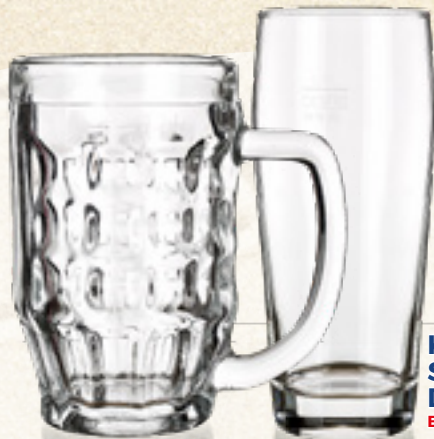
KUFEL/ SZKLANKA 0,5 L DO PIWA Banquet