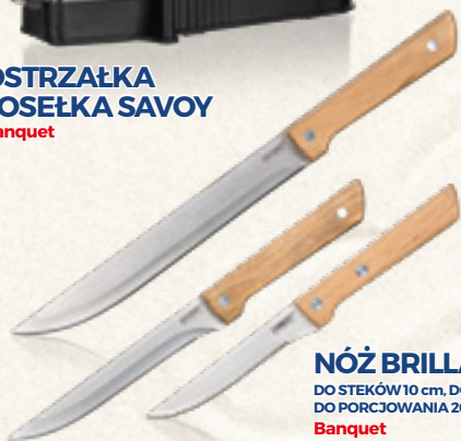
NÓŻ BRILLANTE DO STEKÓW 10 cm, DO TRYBOWANIA 15 cm, DO PORCJOWANIA 20 cm Banquet