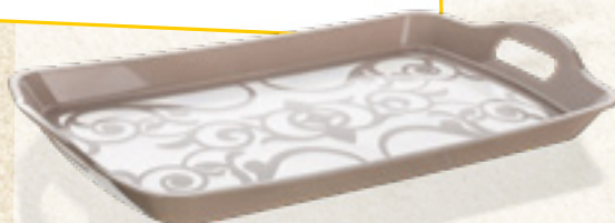
TACA PLASTIKOWA ROMANTIC