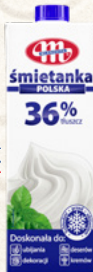
ŚMIETANKA UHT 36% 1L MLEKOVITA