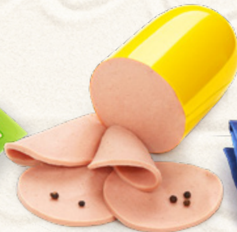
MORTADELA DROBIOWO-WIEPRZOWA YANO ANIMEX FOODS