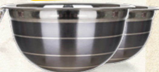
MISKA NIERDZEWNA AVANZA