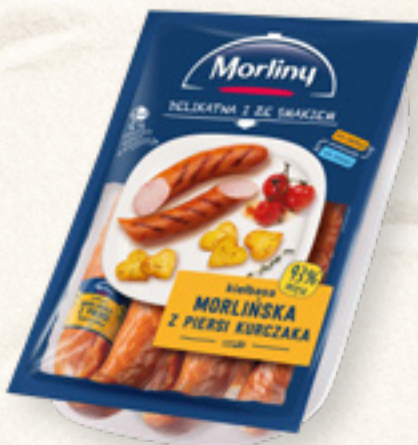
KIEŁBASA MORLIŃSKA Z PIERSI KURCZAKA MORLINY ANIMEX FOODS