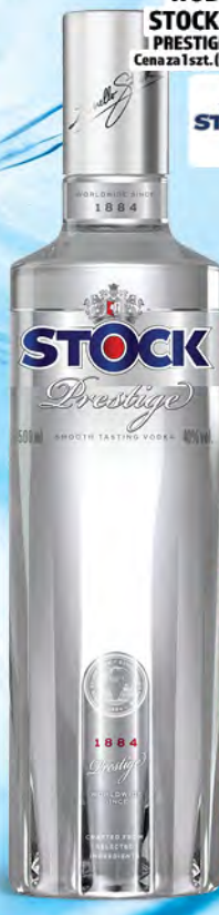
WÓDKA STOCK 0,5L PRESTIGE 40% Cena za 1 szt. (59,98 zł/L)