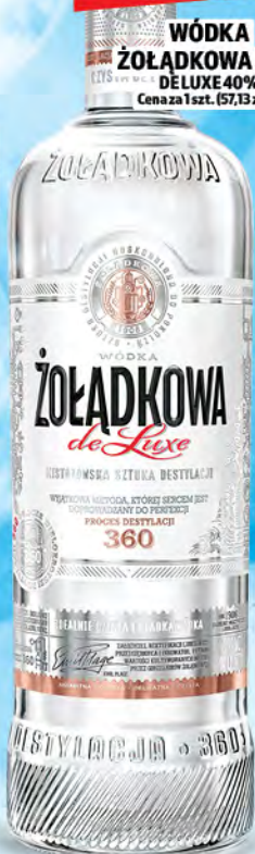
WÓDKA ŻOŁADKOWA 0,7L DELUXE 40% Cena za 1 szt. (57,13 zł/L)