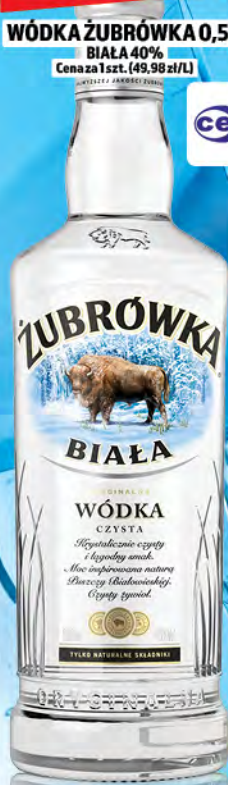
WÓDKA ŻUBRÓWKA 0,5L BIAŁA 40% Cena za 1 szt. (49,98 zł/L)