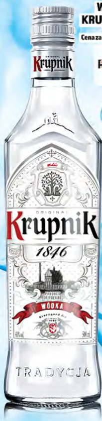
WÓDKA KRUPNIK 0,5L 40% Cena za 1 szt. (49,98 zł/L)