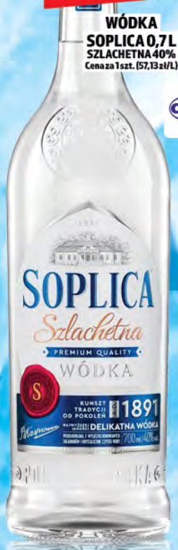
WÓDKA SOPLICA 0,7L SZLACHETNA 40% Cena za 1 szt. (57,13 zł/L)